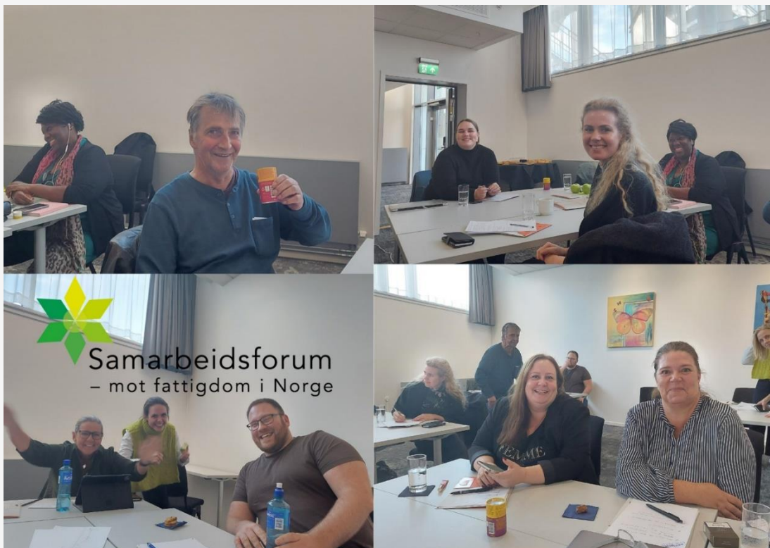
Fra møtet på Gardermoen 23.-24. september