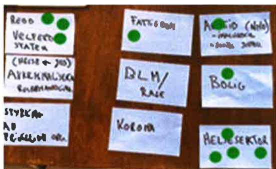
LENT fasiliterte møtet.

Tema: Utvikling av handlingsplan for 2021. Hovedtemaene SF ønsket å sette søkelyset på i 2021 var; Helsesektoren, «redd velferdsstaten», arbeid og inkludering og bolig knyttet opp mot fattigdom og utenforskap.