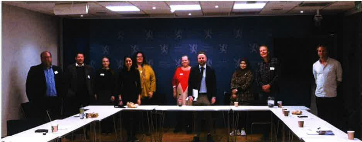
Organisasjonene i møte med Arbeids- og sosialminister Torbjørn Røe Isaksen