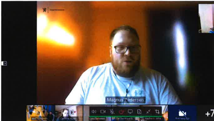
Møte i Kontaktutvalget 27. april