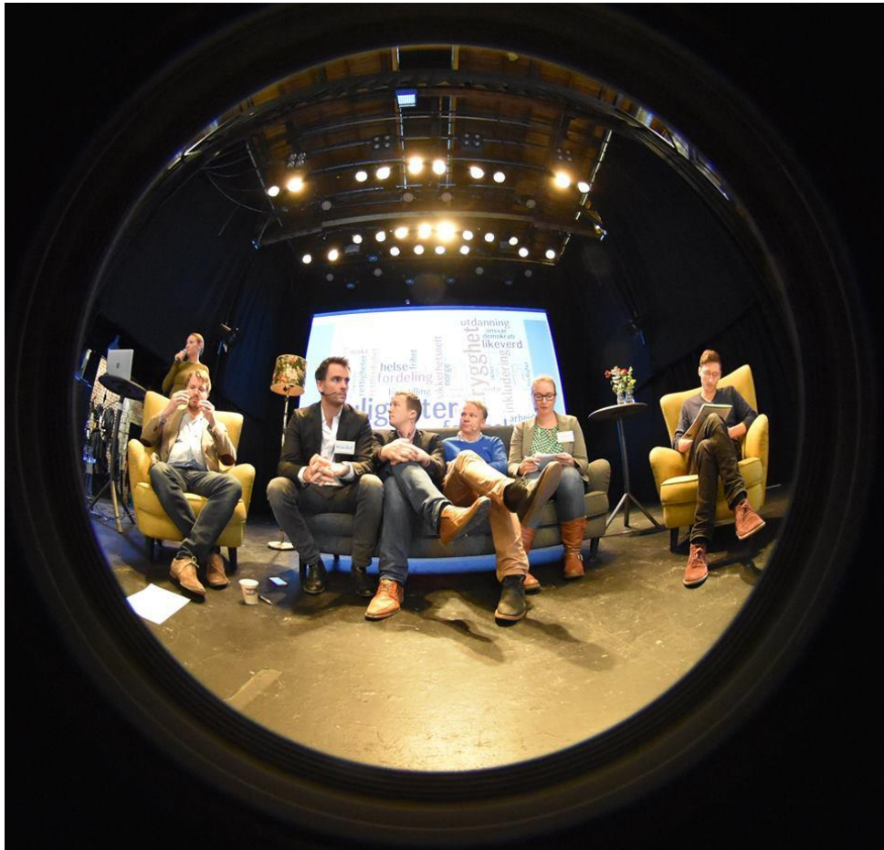
Tankesmiene, «fanget» i linsen