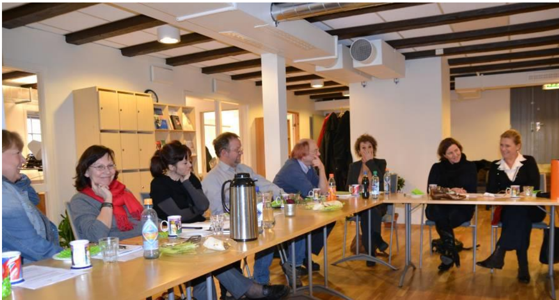
Kontaktutvalget hadde årets siste møte i Batteriets nye lokaler den 21. desember