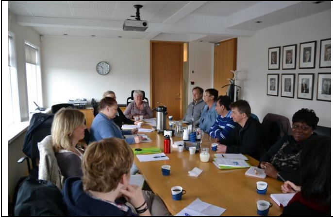
På besøk hos Ministeriet